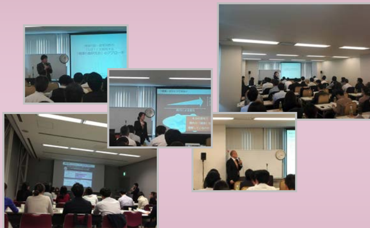
セミナーに参加してよかった

現在、「健康行動研究会」は第2期の参画企業を募集しており、既に多数のご関心をいただいております。今後、このような活動を通して、研究会の発展、ひいては「健康」理解への貢献ができるようますます邁進してまいります。改めて、ご参加の皆様に厚く御礼申し上げます。