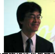
(社)国際経済労働研究所 専務理事兼統括研究員